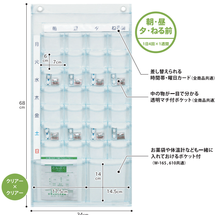
CL (クリアー) 4990630165001

W-165 ウィークリアー投薬ポケット (1日4回分用) ¥ 2,500 (税抜価格)