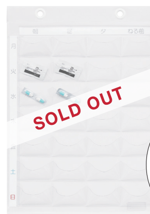
W (ホワイト) 4990630162024