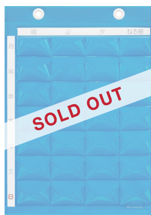
BL (ブルー) 4990630162062

SIZE W32.5 × H46 cm (ポケット入口マチ1.5 cm) 材質 PVC (塩ビ)・低発泡ポリエチレン・プラスチックハトメ・上質紙 lot 1 c / 3 pcs パッケージ フック付きOPP袋入り (W33 × H24 cm)