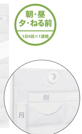
取り出しやすいマチ付ポケット